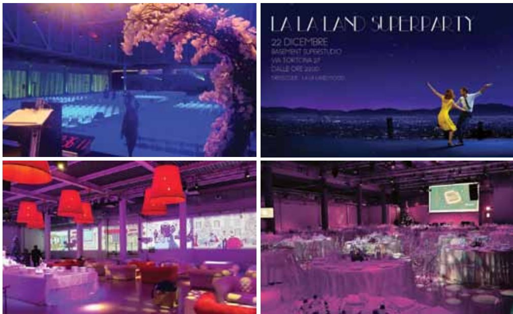
Cene di Natale al Superstudio Più.

È così: anche gli eventi seguono un trend. Sono attraversati da un fil rouge cromatico che si ritrova nella maggior parte di essi. Se nel 2015 è stato il blu profondo, nel 2016 il rosso passione, quest'anno ha visto una vera esplosione del viola nelle sue sfumature, più o meno luminose, dal lilla al viola quasi blu. Un colore inusuale per un evento, non facile ma originale e di grande atmosfera. Qui al Superstudio, il colore colorato viola hanno reso unici eventi per banche d'affari, cene di gala per multinazionali del farmaco, convegni di IT per una volta sbalanzati da una nuance inattesa. E non è un caso che il sempre attesissimo party di fine anno di Superstudio sia in tema La La Land , il musical con i tramonti più spettacolari del cinema nell'ultimo anno.