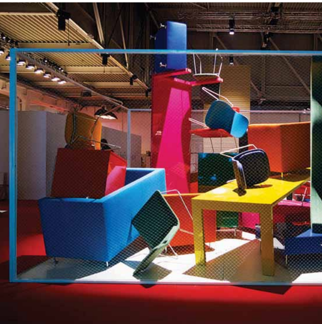
Anno 2000: installazione di Cappellini al Superstudio Più.