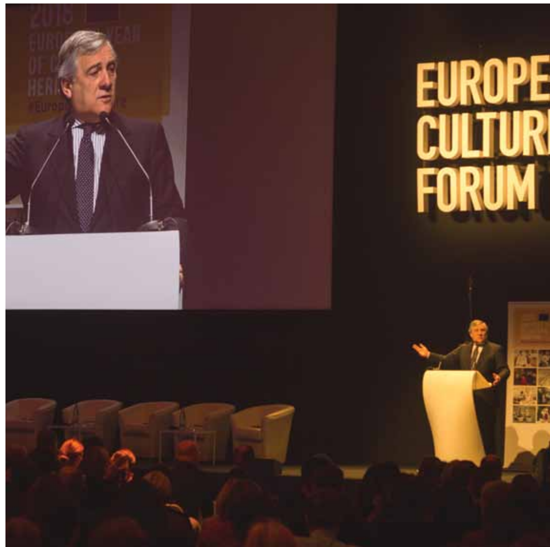
Antonio Tajani, Presidente del Parlamento Europeo.

Dall'alto: Jean-Claude Juncker, Presidente della Commissione Europea; Dario Franceschini, Ministro dei Beni e delle Attività Culturali e del Turismo; Giuseppe Sala, Sindaco di Milano; la sala conferenza gremita durante l'intervento di Tibor Navracsics, Commissario Europeo per l'Istruzione la Cultura la Gioventù e lo Sport; panoramica dell'esposizione sul tema del Patrimonio Culturale mondiale; un momento di relax con il ballo finale; il ledwall di Superstudio per la comunicazione dell'evento all'esterno.