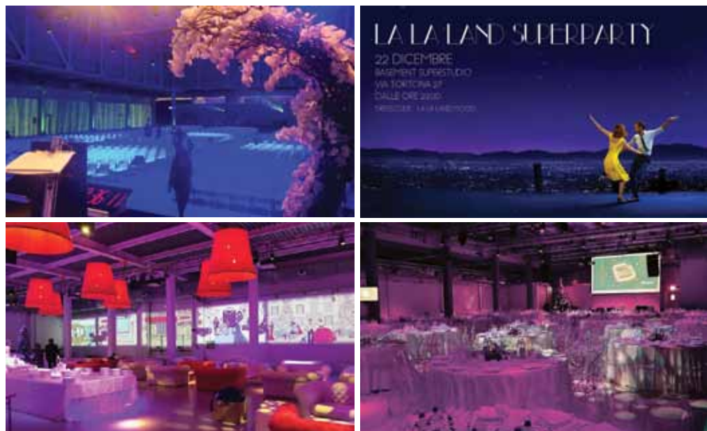
Cene di Natale al Superstudio Più.

È così: anche gli eventi seguono un trend. Sono attraversati da un fil rouge cromatico che si ritrova nella maggior parte di essi. Se nel 2015 è stato il blu profondo, nel 2016 il rosso passione, quest'anno ha visto una vera esplosione del viola nelle sue sfumature, più o meno luminose, dal lilla al viola quasi blu. Un colore inusuale per un evento, non facile ma originale e di grande atmosfera. Qui al Superstudio, luci colorate viola hanno reso unici eventi per banche d'affari, cene di gala per multinazionali del farmaco, convegni di IT per una volta sbanalizzati da una nuance inattesa. E non è un caso che il sempre attesissimo party di fine anno di Superstudio sia in tema La La Land , il musical con i tramonti più spettacolari del cinema nell'ultimo anno.